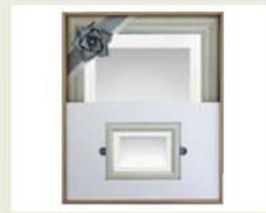
写真(四つ切・小額付)