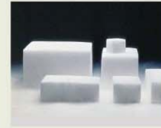
ドライアイス(1日分)